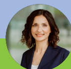
Gabriela Suter Nationalrätin SP