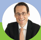
Roger Köppel Nationalrat SVP